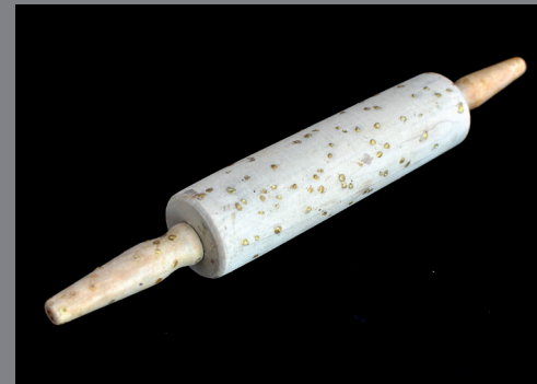
Artefacto I, 2018.

Merche Ber abandona por un tiempo sus herramientas habituales de trabajo para comenzar a modelar a través de los objetos encontrados. Un trabajo muy delicado tanto a nivel emocional -pues se mira como creadora en el otro, vislumbrando lo que puede ser un posible futuro en el olvido, y cuestionando el sentido de su propia obra y su significado- como a nivel material en la recuperación, cuidado e intervención del objeto, resultando una serie de piezas tan bellas como delicadas.