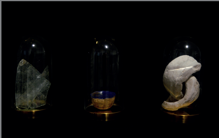
Altar de reliquias, 2020.